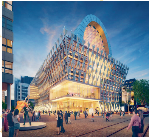
Neutelings Riedijk Architects, ontwerp SpuiForum, Den Haag, 2010

Je vermaken kan in principe overal, maar veel plekken en gebouwen zijn er speciaal voor ontworpen. Denk maar eens aan zwembaden, stadions, musea en theaters. Deze gebouwen zijn vaak opvallend, groot en bijzonder vormgegeven, ze hebben allemaal een andere functie en moeten aan speciale eisen voldoen. Zo moeten bezoekers in een museum een tentoonstelling goed kunnen bekijken en in een theater moeten mensen comfortabel kunnen genieten van een voorstelling.