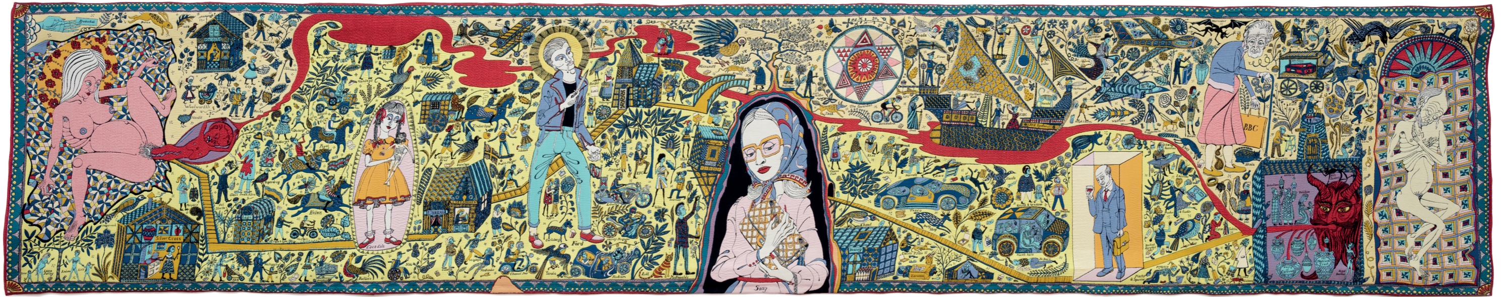
afbeelding 1, 140 x 700 cm