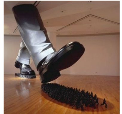
Figuur 2 Do Ho Suh, Karma, 2003