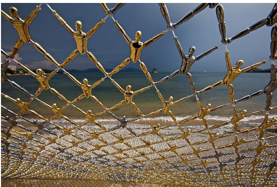
Figuur 3 Do Ho Suh, Net-Work (detail), 2010 gold and chrome plating with polyurethane coating on ABS plastic, nylon fishing net

In veel van zijn sculpturen en installaties maakt Suh gebruik van talloze 'kleine mannetjes' als symbool voor 'de massa'.