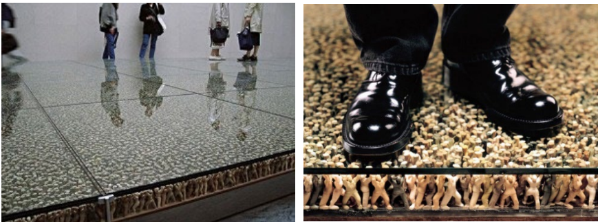
Figuur 1 Do Ho Suh, Vloerinstallatie Biënnale Venetië, 2001

Do Ho Suh is een Zuid-Koreaanse kunstenaar die onderzoekt in zijn werk hoe de persoonlijke ruimte hem de positieve of negatieve kant uitduwt. Hij verkent met zijn werk op een bijzondere manier de relatie tussen collectiviteit, individualiteit en anonimiteit.