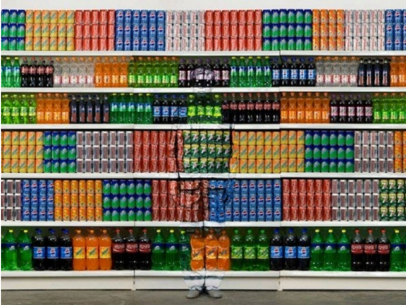
Figuur 1 Liu Bolin, Hiding in the City No. 93 - Supermarket No. 2, 2010, Photograph, (118 x 150 cm)