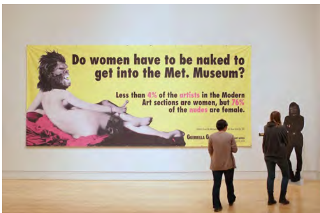
Poster, Guerrilla Girls, Georgia Museum of Art, 2015