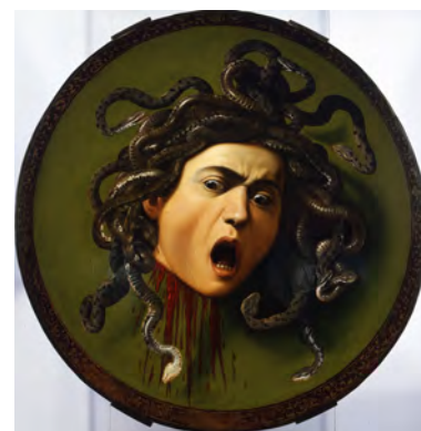
Medusa Murtola, Caravaggio, 1595-1598 Olieverf op een convex schild in populier, 55 × 48 cm, Uffizi, Florence