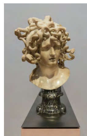
Gian Lorenzo Bernini, Hoofd van Medusa, Marmar, 1630, Rome