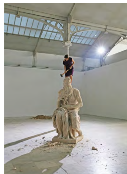
Cristina Lucas 'Habla' performance uit 2008. Filmstill uit de 7 minuten durende video.