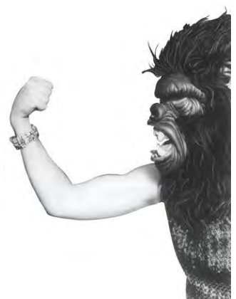
Performance: Guerrilla Girls, 2012