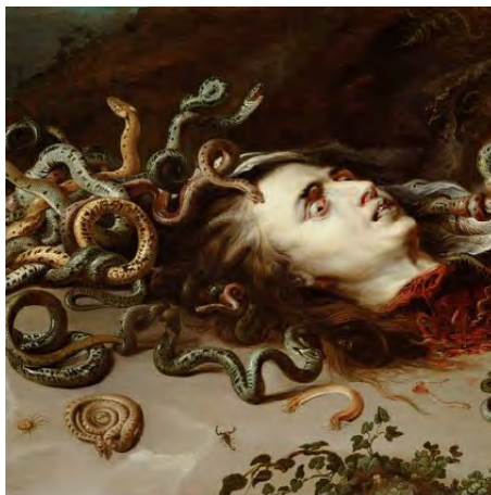
Peter Paul Rubens (1577-1640), Medusa, ca. 1618, olieverf op doek, 68,5 x 118 cm. Wenen