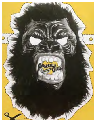
Masker, Guerrilla Girls, 2015